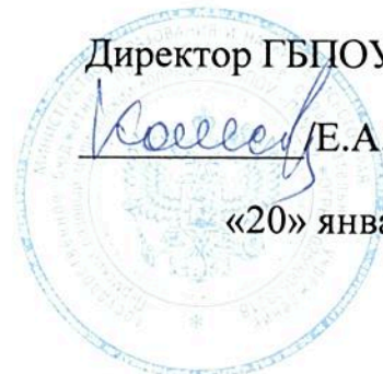
График работы мастерской по компетенции