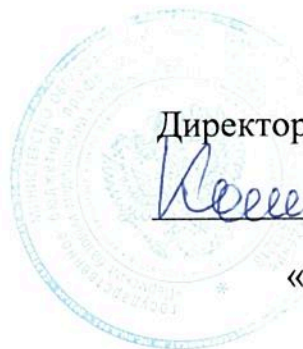
График работы мастерской по компетенции