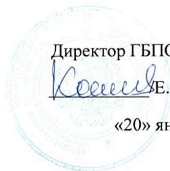
График работы мастерской по компетенции