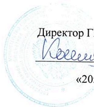
График работы мастерской по компетенции