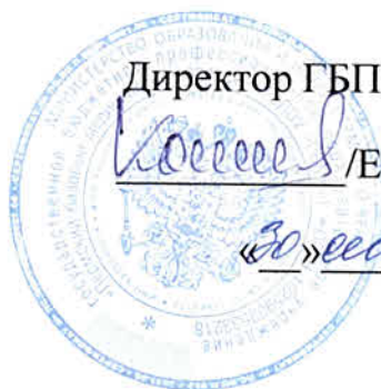
График работы мастерской

по компетенции «Медицинский и социальный уход», 302 кабинет