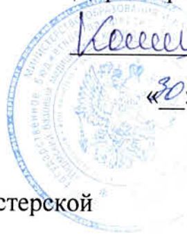
График работы мастерской

по компетенции «Медицинский и социальный уход», 301 кабинет