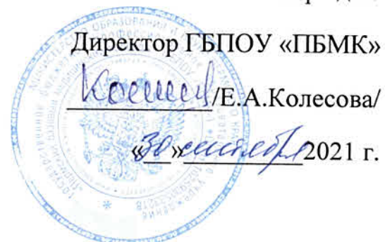
График работы мастерской

по компетенции «Медицинский и социальный уход», 302 кабинет